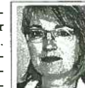
Von Kirsten Boldt

aus. Schön wäre es. Denn der ist überfällig. Die individuelle Unterstützung behinderter Kinder im Regelschulalltag, damit haben Bremen und Berlin bereits Erfahrungen, Länder wie Italien und Finnland setzen seit Jahrzehnten darauf. Zum Wohle aller Schüler: Körperlich oder geistig behinderte Klassenkameraden verändern das Schulklima zum aufmerksameren Umgang miteinander.