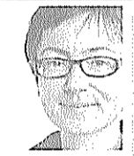
VON MARION EICKLER

Wenn die Inklusion an Regelschulen ernst genommen wird, bedeutet sie aber eine erhebliche Herausforderung in mehrfacher Hinsicht. Die bestehenden Systeme Regelschule und Förderschule müssen bereit sein, sich auf gravierende Umformungsprozesse einzulassen: